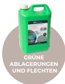
GRÜNE ABLAGERUNGEN UND FLECHTEN